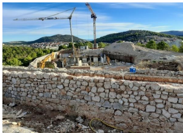
Slika 2. – Radovi na tvrđavi sv. Ivana