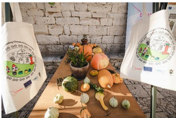
Slika 1. – Zelena tržnica – Na maloј Loži