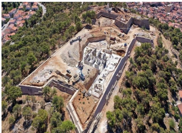
Slika 1. – Prikaz tvrđave sv. Ivana iz zraka