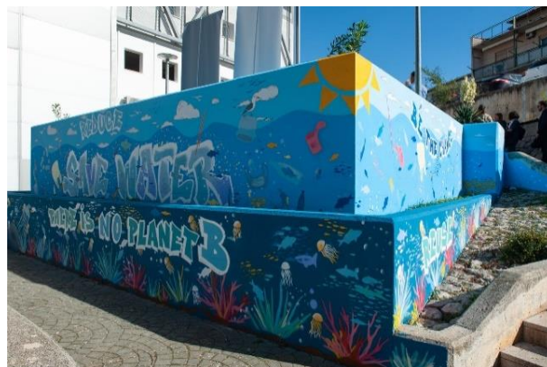
Slika 2. – Street art intervencija – Veleučilište u Šibeniku