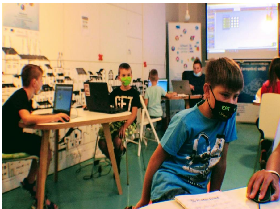
Slika 1. - Radionica Minecrafta

Grad Šibenik je, čim su se pojavile poteškoće u projektu, određene aktivnosti projekta preuzeo na sebe te su organizirane, odnosno nastavljene radionice Minecraft, Scratch, Unity 3D, Radionica robotike te Radionica za rast i razvoj pojedinca. Grad Šibenik je radionice financirao iz vlastitih sredstava, to jest iz sredstava predviđenih za rad Urbanog centra.