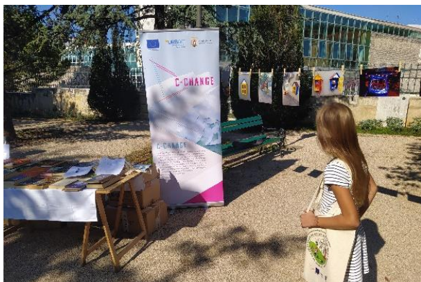
Slika 3. – Pop up book store – Sajam knjiga